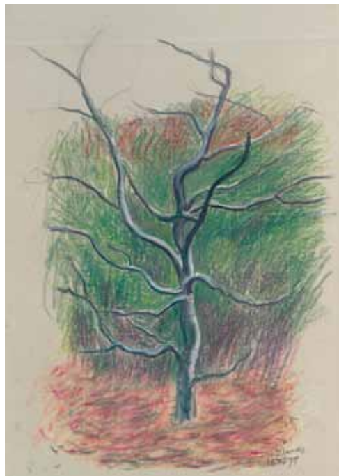
47 Kahler Baum

Ölkreiden, signiert, datiert „21.X.80“, 475 x 327 mm 1980