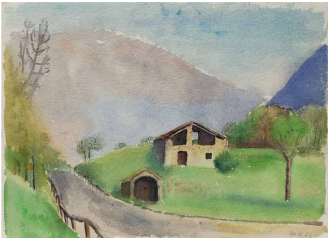
45 Tal zwischen dunstigen Bergen