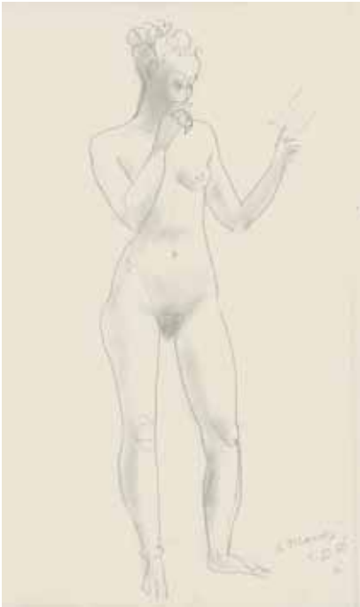
78 Stehende von vorn, einen Brief lesend Bleistift, signiert, datiert „5.III.66“ (rückseitig motivgl. Darstellung), P.: 500 x 305 mm, D.: 410 x 165 mm 1966