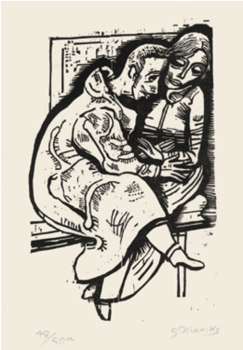
90 Verführer (Paar) Holzschnitt auf Japan, signiert, numeriert, Lammek H 80, 237 x 147 mm 1923