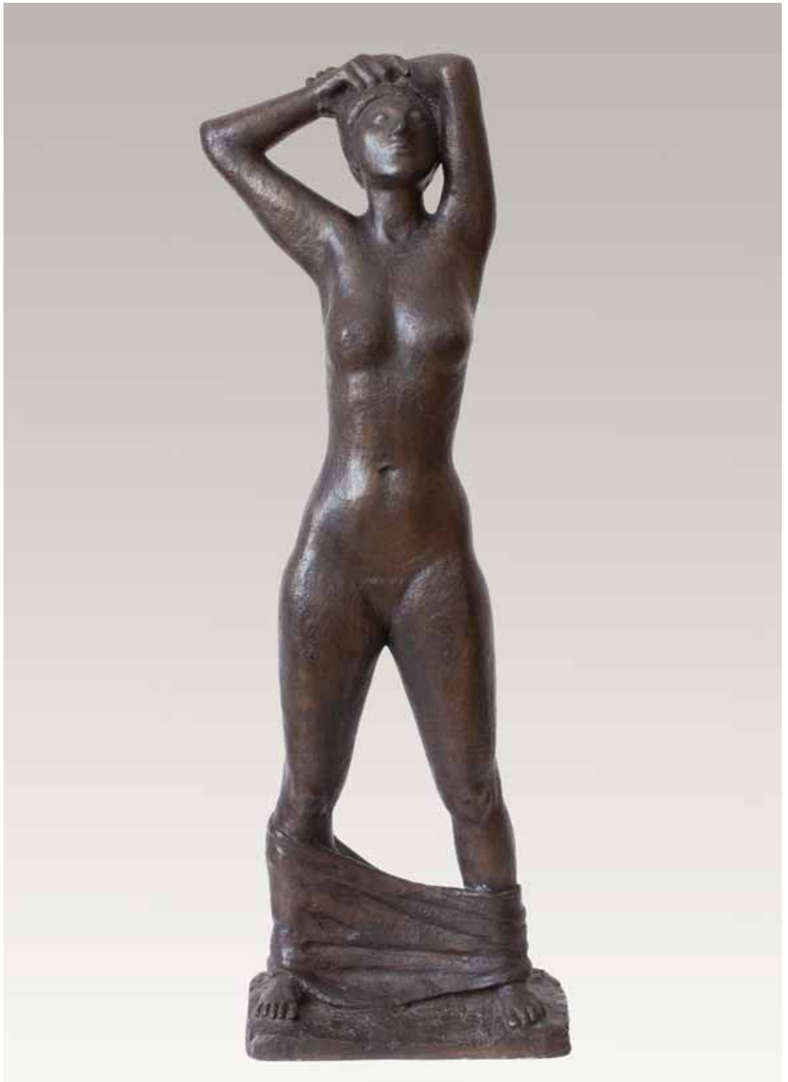
1 Zoe Bronze, monogrammiert, numeriert, Gußstempel Barth, Rinteln, Rudloff 959, Höhe 84 cm 1970