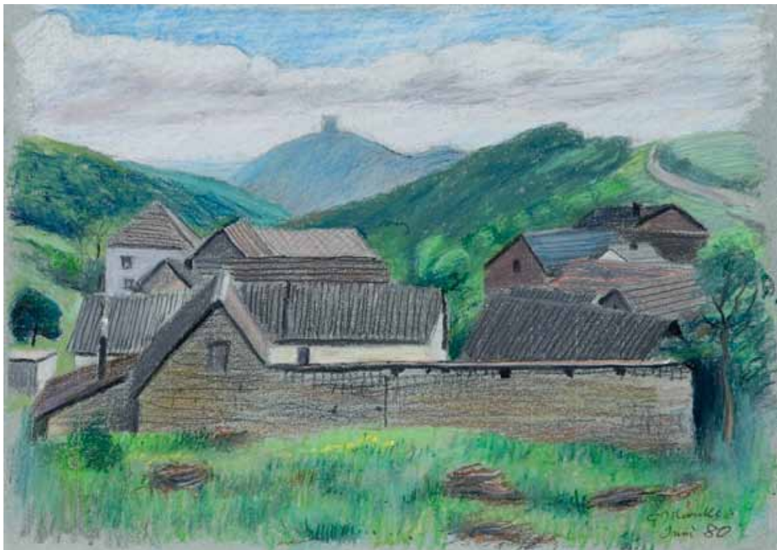
53 Eifeldorf mit Burg in der Ferne

Ölkreiden, signiert, datiert „Juni 80“, 327 x 462 mm 1980