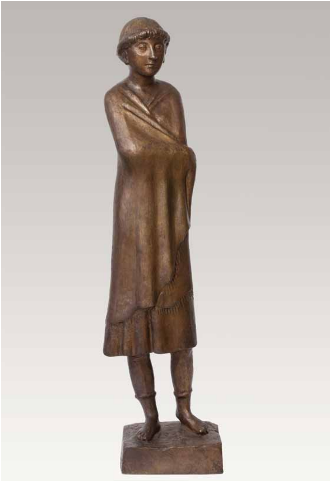
40 Odi (klein)

Bronze, monogrammiert, numeriert, Gußstempel Barth, Rinteln, Rudloff 1138, Höhe 81 cm 1975