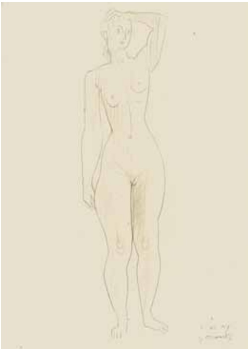
80 Stehender Mädchenakt, linke Hand am Kopf Bleistift, signiert, datiert „1.XI.47“, P.: 435 x 310 mm, D.: 390 x 100 mm 1947