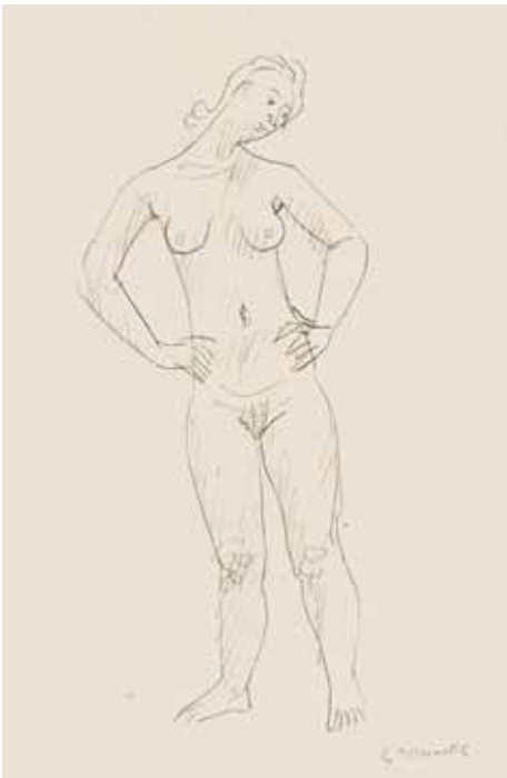
82 Stehende von vorn, Hände auf den Hüften

(Studie zu Rudloff 972, rückseitig motivgl. Dartstellung), P.: 435 x 275 mm, D.: 350 x 150 mm um 1970