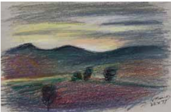
51 Felder und Hügel im Abendlicht