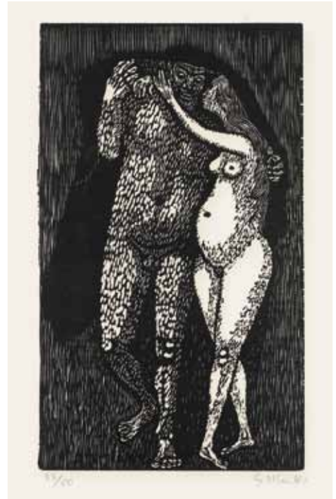
Holzschnitt auf Japan, signiert, numeriert, Lammek H 271, 300 x 178 mm 1956