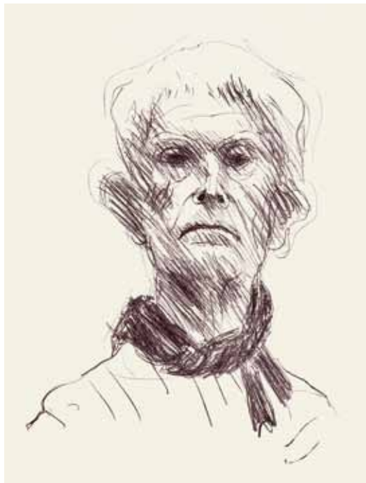
96 Selbstbildnis (von vorn mit Schal)

Lithographie, signiert, numeriert, Lammek L 35, 315 x 229 mm 1969