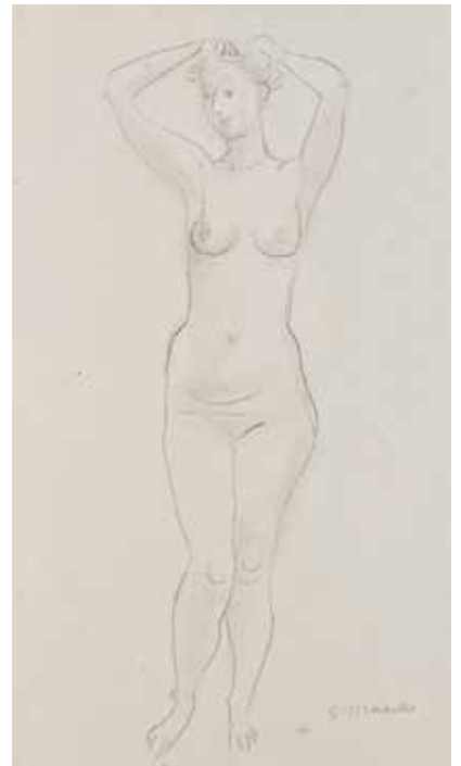
81 Stehender Mädchenakt, das Haar ordnend Bleistift, sig. (rückseitig motivähnl. Darstellung), P.: 480 x 325 mm, D.: 430 x 145 mm um 1960