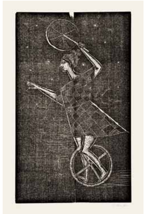
Holzschnitt auf Japan, signiert, numeriert, Lammek H 240, 483 x 293 mm 1954