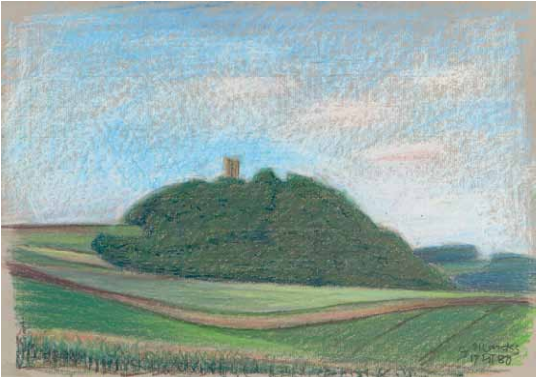
48 Burg Olbrück über dem Wald Ölkreiden, signiert, datiert „17.VII.80“, 325 x 464 mm 1980