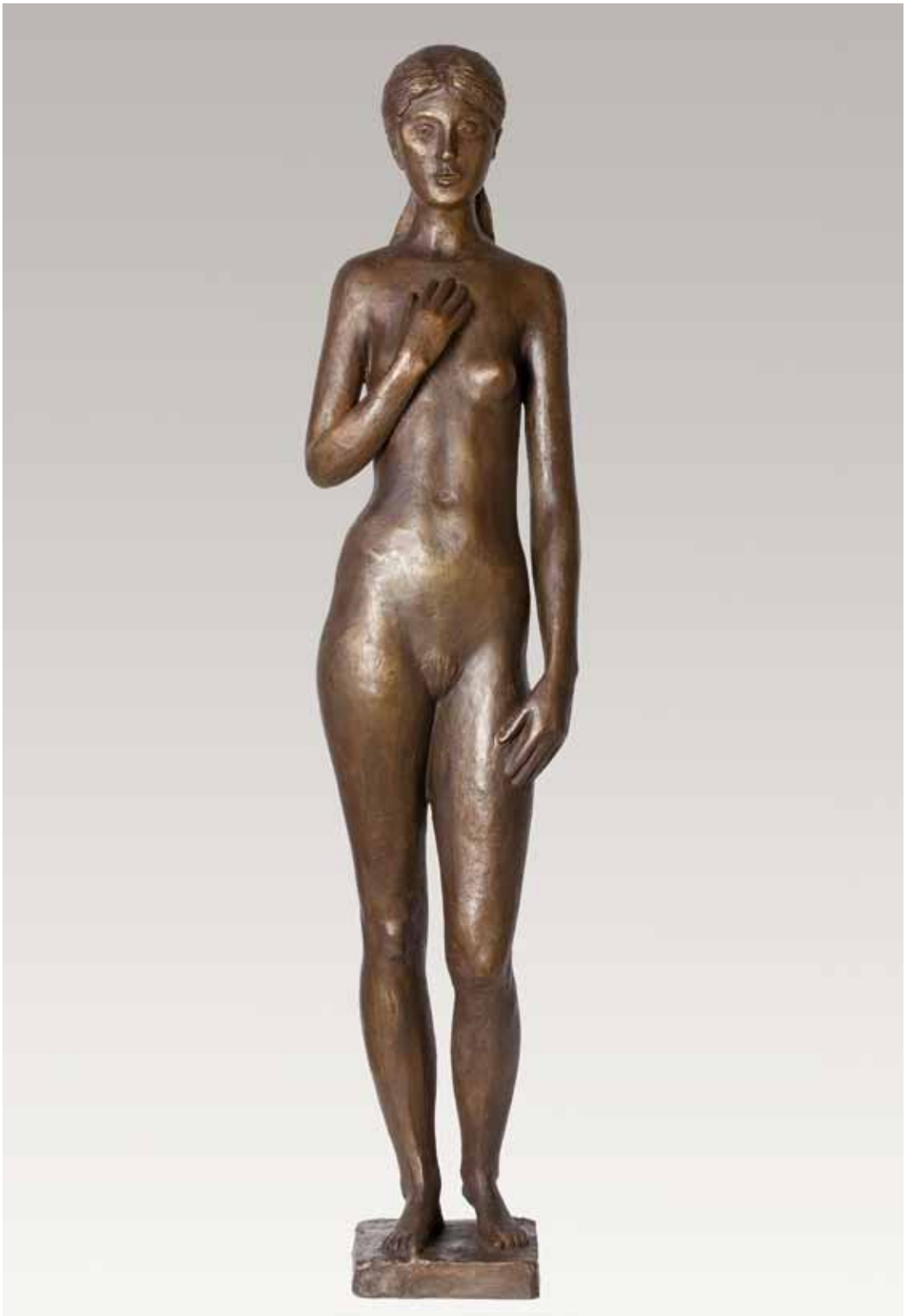
41 Thora Bronze, monogrammiert, numeriert, Gußstempel Barth, Rinteln, Rudloff 1099, Höhe 81 cm 1977