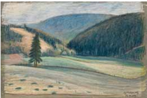
49 Im Gebirge