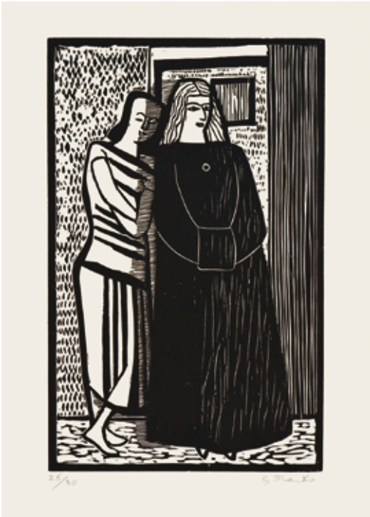
92 Im Konzert