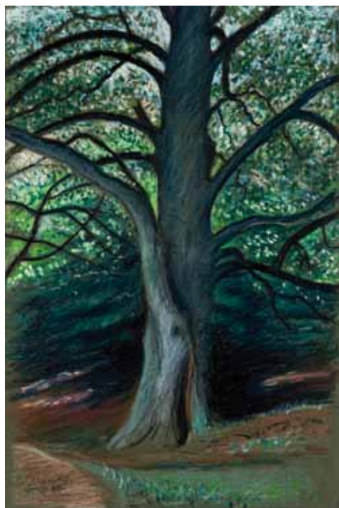
55 Alter Baum

Ölkreiden, signiert, datiert „25.XI.78“, 379 x 320 mm 1978