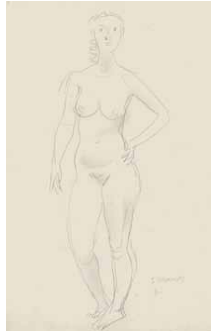
79 Stehende, linke Hand auf linker Hüfte Bleistift, sig. (rückseitig motivgl. Darstellung), P.: 455 x 325 mm, D.: 405 x 150 mm um 1962